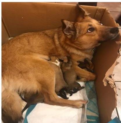
Alice med sina valpar