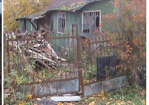
Huset som senare brann ner