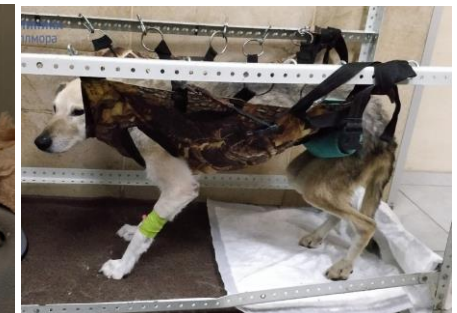
Laska tränar upp sina muskler